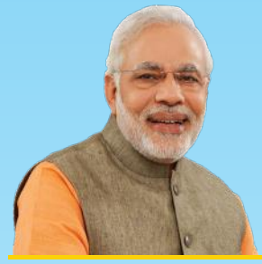
नरेंद्र मोदी प्रधानमंत्री