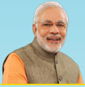
श्री नरेन्द्र मोदी प्रधानमंत्री